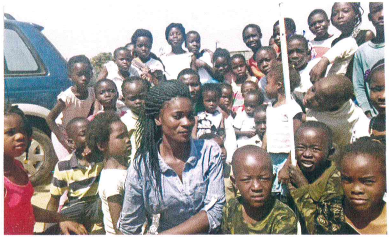
Die Lehrerin mit ihren Schützlingen.